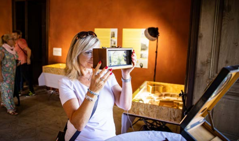
U stereoskopů A. Rückla