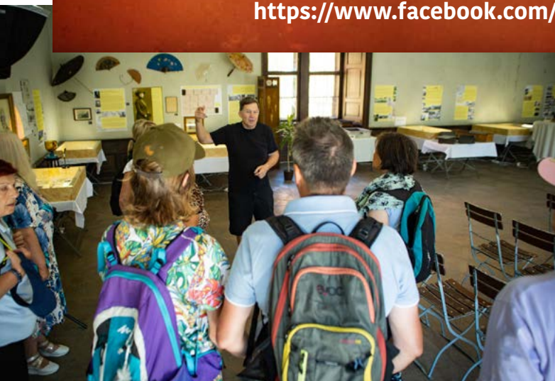
Ve výstavním a koncertním sálu na zámku

https://www.facebook.com/lobkowiczovedolnoberkovsti/