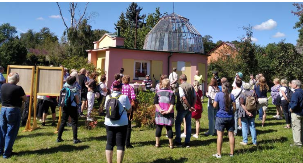
Veřejná prohlídka lázní