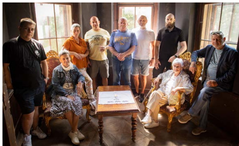
Barcalovi ve věži zámku