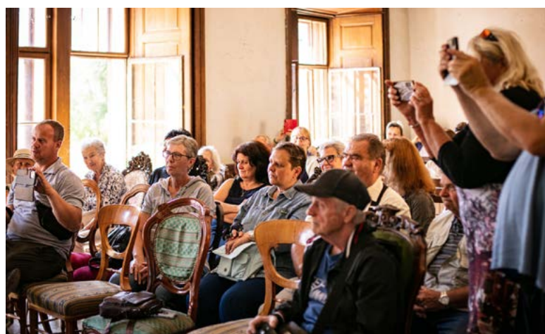
Návštěvníci při udělování patriota