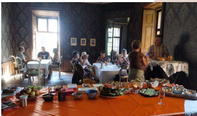
Občerstvení v Salonu Bondy