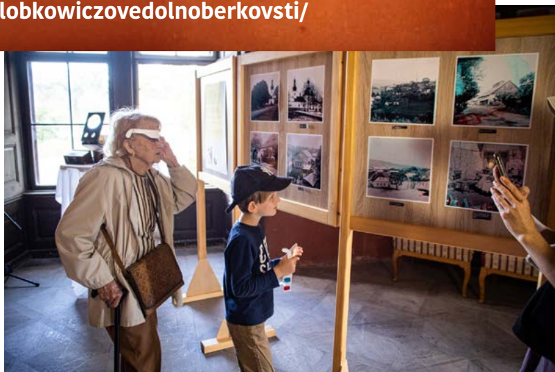
3D fotografie A. Rückla