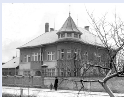
Císařova vila kolem roku 1940.