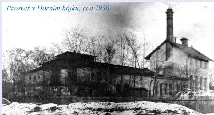
Pivovar v Horním hájku, cca 1930.