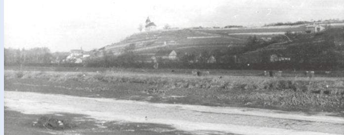
Labe po zimním vyhrazení jezu, rok 1964.

Nebe olovem se nízko nad zem klene, těžké, nehybné a plno přístích sněhů. Labe temně proudí kol zavátých břehů, kde se černají jen holé prutiny, vrby prořídle se kloní nad řečiště, plné drobné, ostře se troucí tříště, křehce lámavě jak ječné osiny. Smutnou únavou klid zimy v polích leží. Od vody vzduch fíčí suše řezavý, po závějích sypce rozšlehaných běží, podél silnice se v stromech zastaví, zkrchlým třese větrovím – a prší jíní po chomáčích měkce za jasnějších dnův, stříbrná jak hvězdy pohádkových siní, vidiny co dětských kouzlili nám snův.