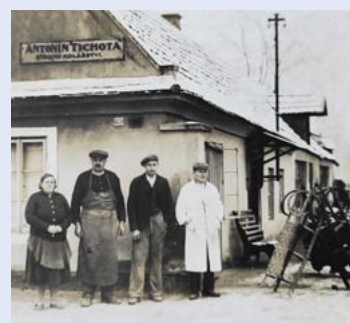
Strojní kolářství Tichoty ve Vliněvsi.