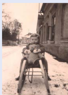
V Mělnické ulici u Bryslivců, cca 1960.