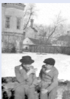
Partie ze zámeckého parku, cca 1930.