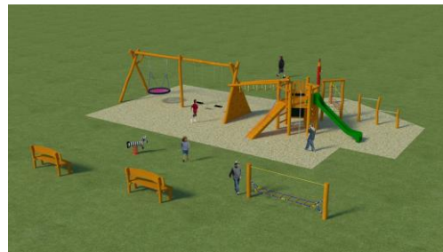
Dětské hřiště TJ Sokol D. B.

V únoru podala obec žádost o dotaci z dotačního titulu Ministerstva pro místní rozvoj ČR (MMR) k získání financí na výstavbu dvou dětských hřišť. Je počítáno s výstavbou nového dětského hřiště v prostorech sportovního areálu TJ Sokol D. Beřkovice a rozšíření dětského hřiště v areálu restaurace Na Knížecí. V rámci tohoto projektu je pamatováno na pořízení herních prvků pro MŠ.