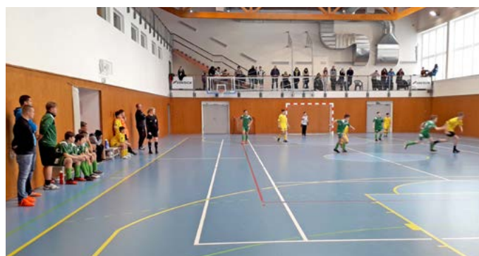
Celkové umístění oddílů